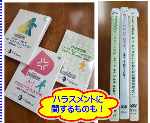
ハラスメントに関するもの!

10月からは、令和5年度後期スケジュールとして10月~2月まで開催予定となっております。前期同様、毎週第2・第4水曜日の11:00~13:00にかながわ労働プラザ1階受付前交流広場にて開催いたしますので、前期にスケジュールが合わずにご来館出来なかった皆様につきましては、あらためてこの機会に当館まで足をお運び下さい。ご来館お待ちしております。