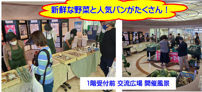
新鮮な野菜と人気パンがたくさん!