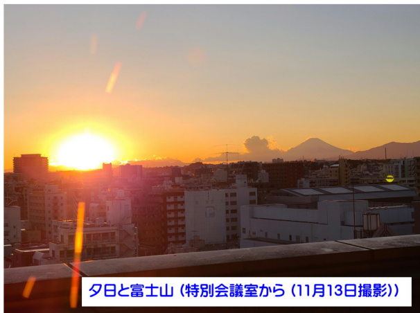
夕日と富士山 (特別会議室から (11月13日撮影))

10月から新たに生け花のボランティアさんが正面入口のカウンターにお花を展示して下さっています。写真は10月10日~14日に飾っていただいた作品になります。皆様是非当会館に立ち寄っていただき、鮮やかで華やかなお花をご覧になっていただくとともに、折々の季節を感じていただければと思います。