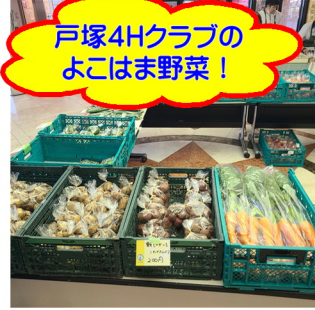
戸塚4Hクラブのよこはま野菜!