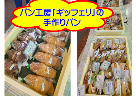
パン工房「ギッフェリ」の手作りパン